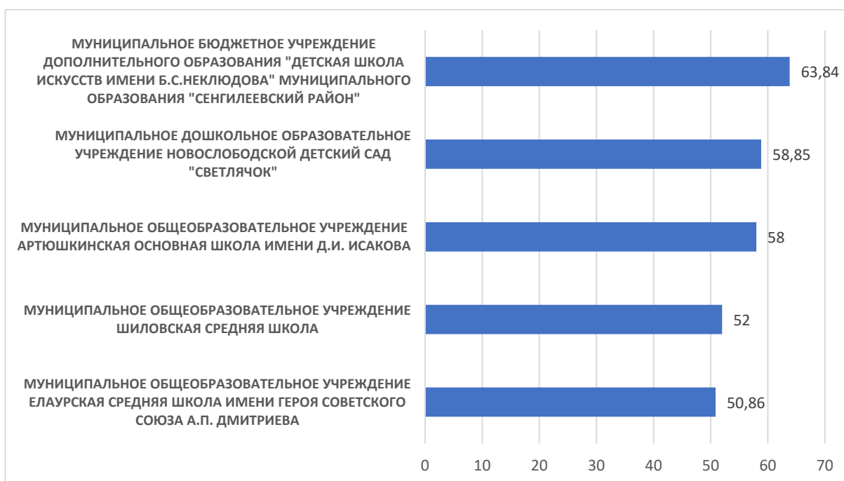
Рисунок 3 – Рейтинг организаций по критерию «Доступность образовательной деятельности для инвалидов»

По третьему критерию «Доступность образовательной деятельности для инвалидов» максимальный результат 63,84 балла набрало МУНИЦИПАЛЬНОЕ БЮДЖЕТНОЕ УЧРЕЖДЕНИЕ ДОПОЛНИТЕЛЬНОГО ОБРАЗОВАНИЯ "ДЕТСКАЯ ШКОЛА ИСКУССТВ ИМЕНИ Б.С.НЕКЛЮДОВА" МУНИЦИПАЛЬНОГО.