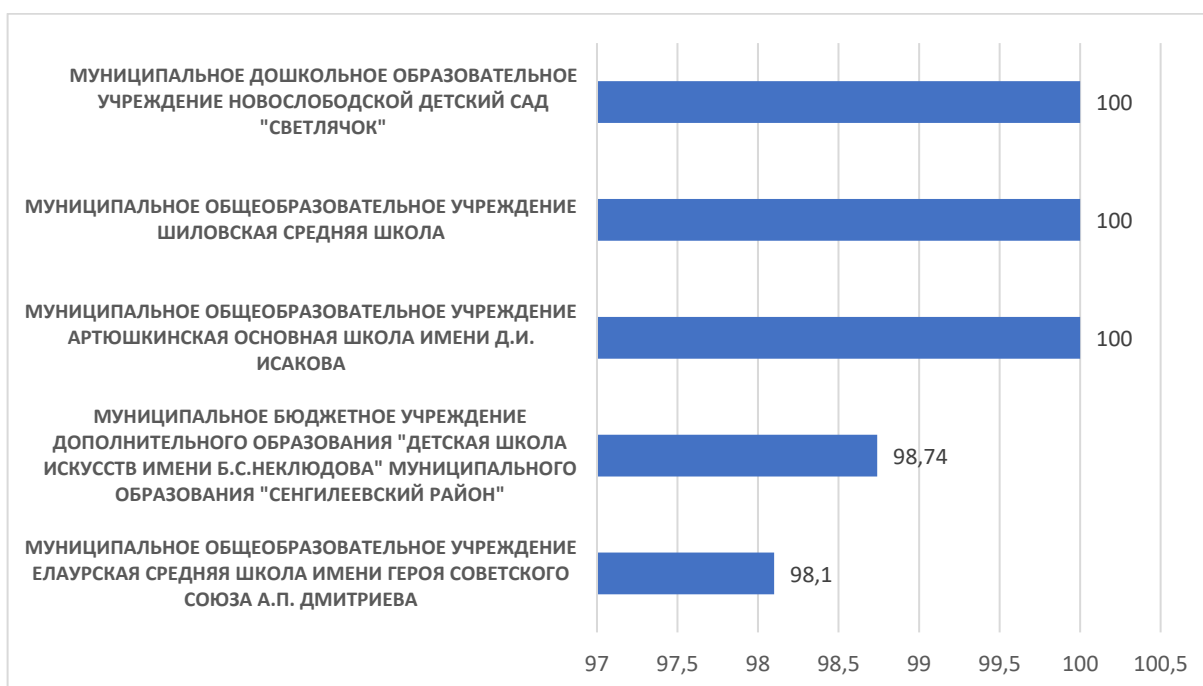
Рисунок 4 – Рейтинг организаций по критерию «Доброжелательность, вежливость работников организации»

По четвертому критерию «Доброжелательность, вежливость работников организации» максимальный результат 100 баллов набрали МУНИЦИПАЛЬНОЕ ДОШКОЛЬНОЕ ОБРАЗОВАТЕЛЬНОЕ УЧРЕЖДЕНИЕ НОВОСЛОБОДСКОЙ ДЕТСКИЙ САД "СВЕТЛЯЧОК", МУНИЦИПАЛЬНОЕ ОБЩЕОБРАЗОВАТЕЛЬНОЕ УЧРЕЖДЕНИЕ ШИЛОВСКАЯ СРЕДНЯЯ ШКОЛА, МУНИЦИПАЛЬНОЕ ОБЩЕОБРАЗОВАТЕЛЬНОЕ УЧРЕЖДЕНИЕ АРТЮШКИНСКАЯ ОСНОВНАЯ ШКОЛА ИМЕНИ Д.И. ИСАКОВА.