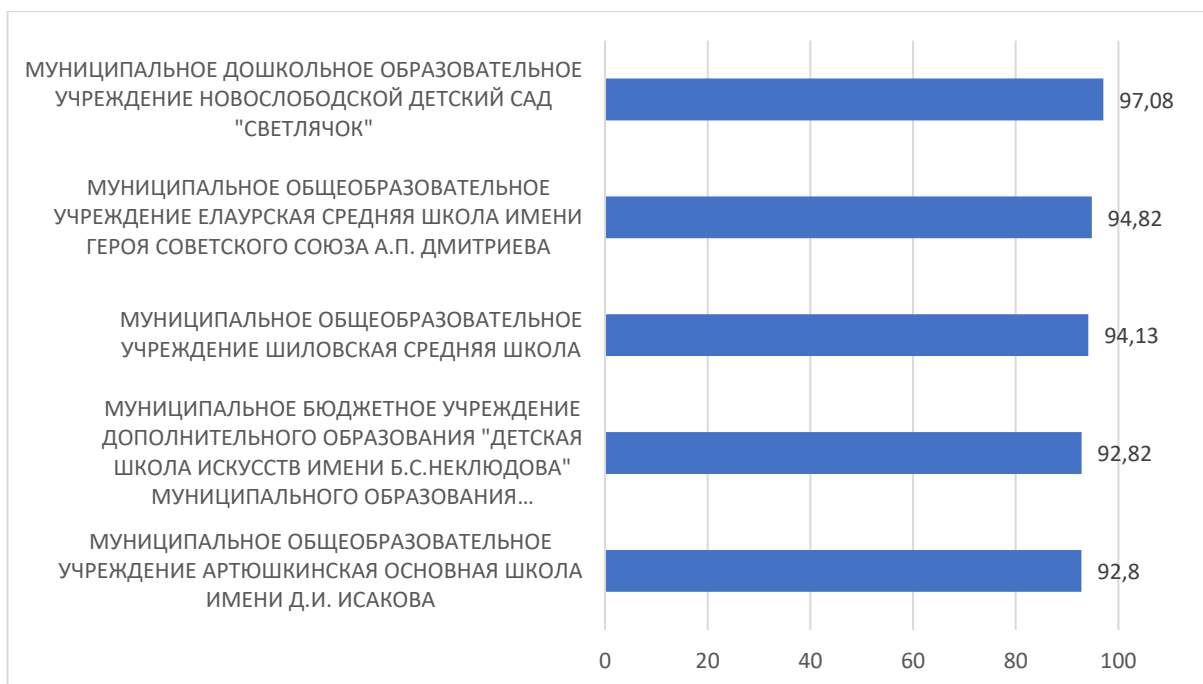
Рисунок 1 – Рейтинг организаций по критерию «Открытость и доступность информации об организации, осуществляющей образовательную деятельность»

По первому критерию «Открытость и доступность информации об образовательной организации» максимальный результат 97,08 баллов набрало МУНИЦИПАЛЬНОЕ ДОШКОЛЬНОЕ ОБРАЗОВАТЕЛЬНОЕ УЧРЕЖДЕНИЕ НОВОСЛОБОДСКОЙ ДЕТСКИЙ САД "СВЕТЛЯЧОК".