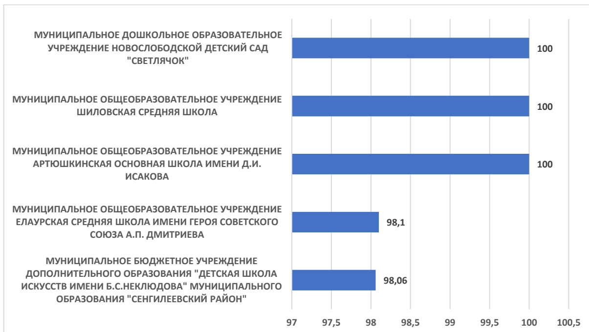
Рисунок 5 – Рейтинг организаций по критерию «Удовлетворенность условиями осуществления образовательной деятельности организаций»

По пятому критерию «Удовлетворенность условиями осуществления образовательной деятельности организаций» максимальный результат 100 баллов набрали МУНИЦИПАЛЬНОЕ ДОШКОЛЬНОЕ ОБРАЗОВАТЕЛЬНОЕ УЧРЕЖДЕНИЕ НОВОСЛОБОДСКОЙ ДЕТСКИЙ САД "СВЕТЛЯЧОК", МУНИЦИПАЛЬНОЕ ОБЩЕОБРАЗОВАТЕЛЬНОЕ УЧРЕЖДЕНИЕ ШИЛОВСКАЯ СРЕДНЯЯ ШКОЛА МУНИЦИПАЛЬНОЕ ОБЩЕОБРАЗОВАТЕЛЬНОЕ УЧРЕЖДЕНИЕ ШИЛОВСКАЯ СРЕДНЯЯ ШКОЛА МУНИЦИПАЛЬНОЕ ОБЩЕОБРАЗОВАТЕЛЬНОЕ УЧРЕЖДЕНИЕ АРТЮШКИНСКАЯ ОСНОВНАЯ ШКОЛА ИМЕНИ Д.И. ИСАКОВА.